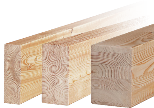
KVH DUO BSH