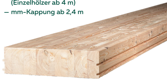
BSH-Decke in Lärche